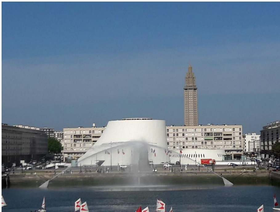
Vue du bassin du commerce : courbes et droites