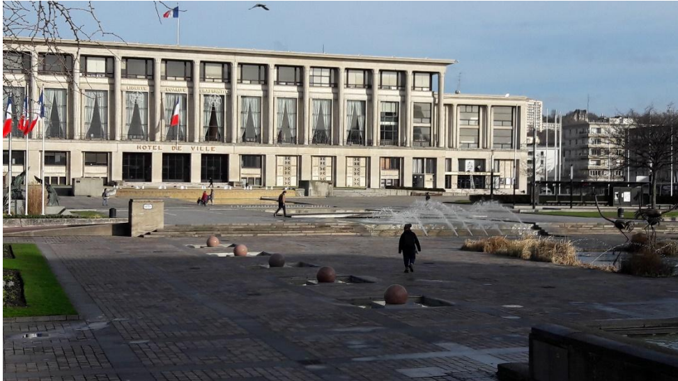
L'Hôtel de ville : un exemple du classicisme structurel d'Auguste Perret

Nous terminons notre déambulation dans le centre-ville reconstruit place de l'hôtel de ville ce qui nous offre l'occasion de revenir sur le « classicisme structurel » d'Auguste Perret et son usage du béton.