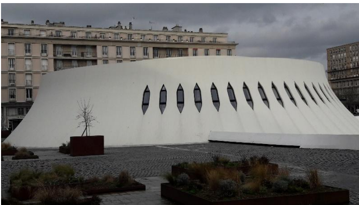
Hyperboloïde de révolution

Poursuivant notre promenade, l'espace Niemeyer et ses deux volumes principaux se présente à nous : la médiathèque et son tronc d'hyperboloïde de révolution d'une part et le Volcan (salles de spectacles) et son parabolôïde hyperbolique, tous deux conçus par l'architecte brésilien Oscar Niemeyer ainsi que l'espace dans lequel ils se distribuent qui a la forme d'une colombe (de la paix).