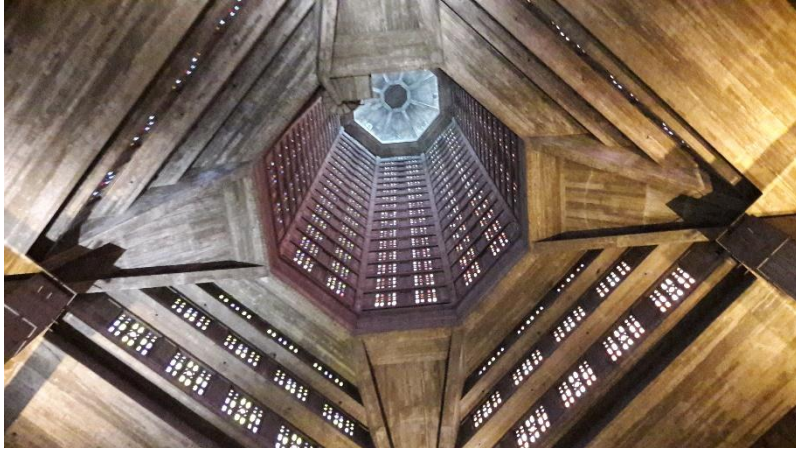
Le clocher de l'église Saint Joseph vu de l'intérieur