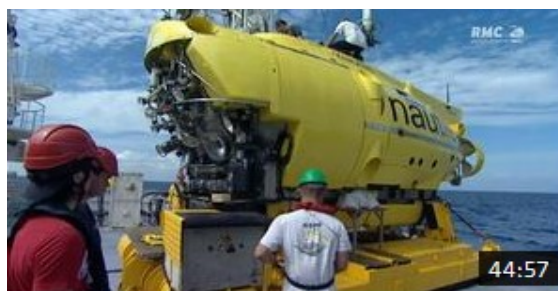
Mayday danger dans le ciel - vol Air France 447