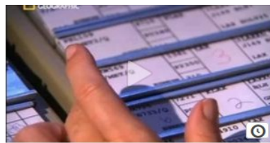
Mayday danger dans le ciel - Vol US Airways 1493 Par Danger-dans-le-ciel

Les vidéos de la série sont regroupées sur DailyMotion 3 ou sur YouTube 4 . Voici deux situations décrites et analysées. Chacune présente une charge d'informations particulièrement importante.