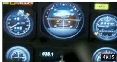
Mayday danger dans le ciel - Vol AA 96 et Turkish 981