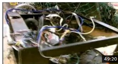
Mayday danger dans le ciel - Vol air India 182