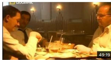
Mayday danger dans le ciel - Vol Gol 1907 & November 600 X-ray Lima Par Danger-dans-le-ciel