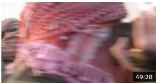
Mayday danger dans le ciel - Vol DHL Oscar Lima Lima Le