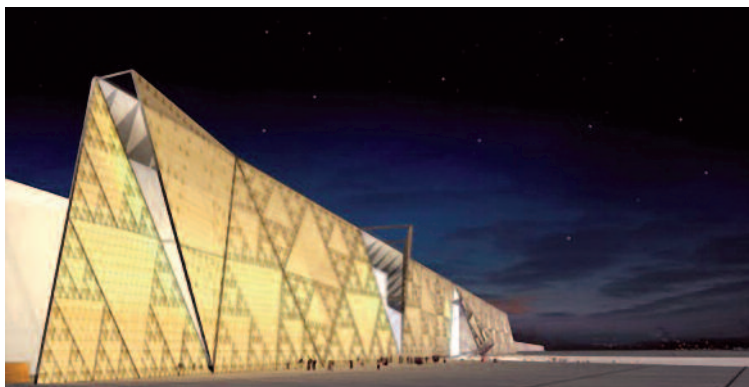
Vue d'artiste du futur musée.

En 2018 ouvrira le grand musée égyptien du Caire. Les pharaons du Caire pourront bientôt contempler le triangle de Sierpiński puisque les architectes du futur « grand musée égyptien » ont conçu une façade imposante qui en reprend le motif principal.