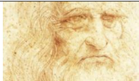
Atelier « Léonard mathématicien ? »

Il suffit d'aller sur le site à l'heure de l'atelier, en prévoyant quelques minutes d'avance, et cliquer sur le lien dédié pour aller sur une classe virtuelle. Un système de chat permettra les échanges en cas d'absence de micro.