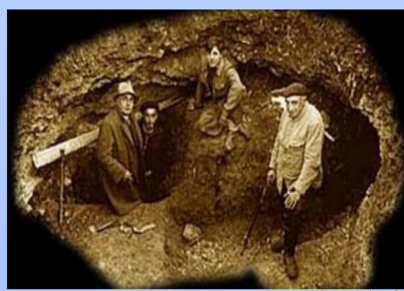
Les « découvreurs » de la grotte de Lascaux